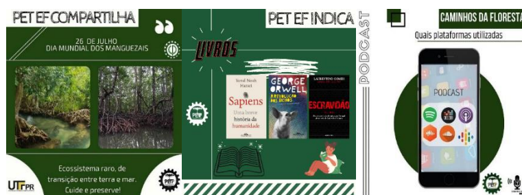
Figura 1: Artes das atividades realizadas.